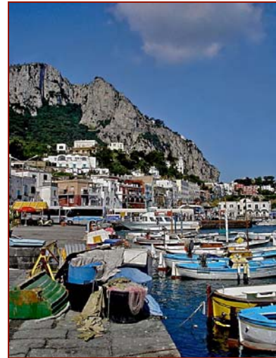
Le port de Capri

Visite de Ravello , perchée sur un éperon rocheux, avec ses petites rues et ses passages voûtés et de la Villa Cimbrone et ses jardins romantiques dominant la baie. Cette célèbre villa fut construite au début du XX e siècle par un noble anglais. Cette villa imite les formes classiques des styles médiévaux. Sa célébrité