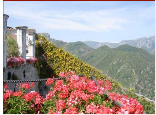
Villa Rufolo à Ravello

Le programme proposé ci-dessus ne peut être qu'indicatif, les visites étant soumises aux aléas des ouvertures des sites et des monuments.