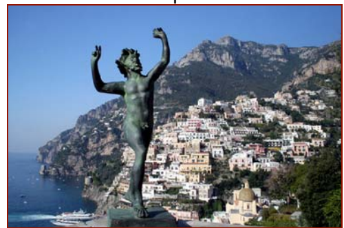
Positano le sentier des Dieux